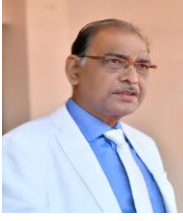
डॉ. केशरी लाल वर्मा कुलपति