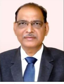
डॉ.केशरी लाल वर्मा कुलपति