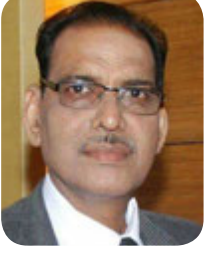
डॉ. केशरी लाल वर्मा कुलपति