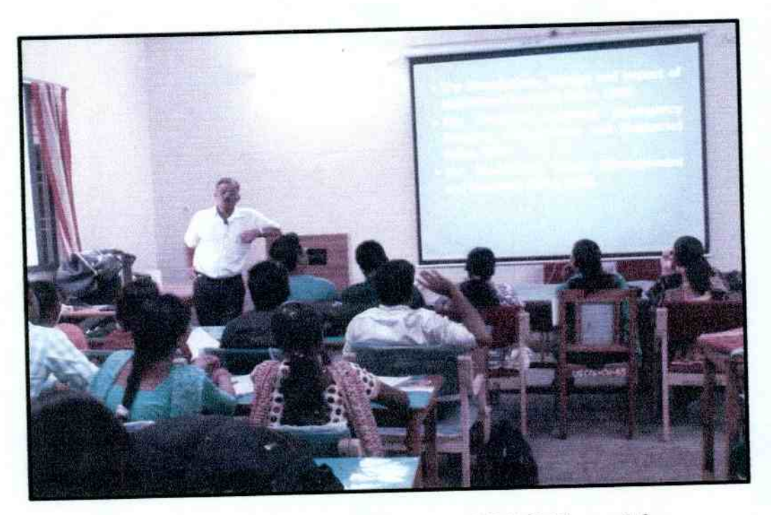
Photographs of PSC Pre. 2016 Coaching