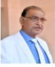
डॉ. केशरी लाल वर्मा कुलपति