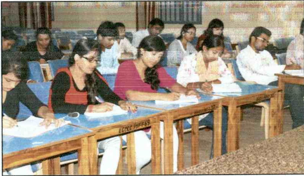
Photographs for Bank & SSC exam