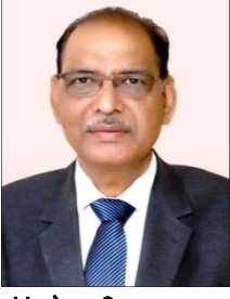
डॉ.केशरी लाल वर्मा कुलपति